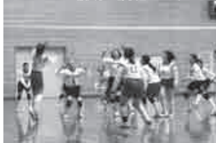
バレーボール一般女子の部予選のようす

6 月 24 日から 7 月 8 日にかけて、府総合体育大会の泉北地区予選が行われました。本市からは次の団体が府総合体育大会に進出します。 バレーボール ▷一般女子の部…第 2 位 卓球 ▷一般男子の部…第 1 位 ▷一般女子の部…第 2 位 テニス ▷一般男子の部…第 2 位 軟式野球 ▷一般男子の部…第 2 位 バドミントン ▷一般男子の部…第 2 位 ソフトテニス 開催市枠