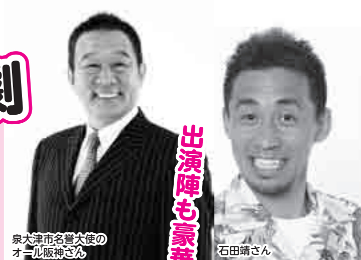
泉大津市名誉大使の オール阪神さん

料金 ▼前売 1500 円 ▼当日 2000 円（自由席）※ 8 月 1 日(火)から販売開始 チケット販売場所 ▼市役所（4 階 企画調整課内）▼南北公民館 ▼総合体育館 ▼市民会館 ▼泉大津商工会議所 ▼パークゴルフ泉大津 ▼テクスピア大阪 ▼泉大津市・高石市・忠岡町の郵便局 問合 よしもと新喜劇泉大津公演実行委員会（市役所 4 階 企画調整課内） ※駐車台数には限りがありますので、できる限り公共交通機関や、自転車・徒歩などでご来場ください。