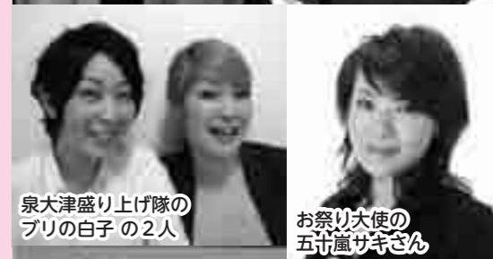
泉大津盛り上げ隊の プリの白子の 2 人