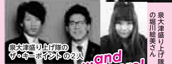
泉大津盛り上げ隊の ザ・キーポイントの 2 人