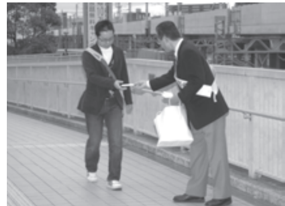
人権週間にちなみイベントなどを開催

11月14日は穴師公園、15日には大津川河川敷、12月6日には、板原老人少年憩いの広場(キリン公園)で、たくさんのボランティアの小・中学生が集まり、公園や河川敷を清掃しました。