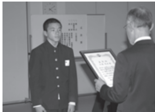
36人1団体に教育委員会表彰