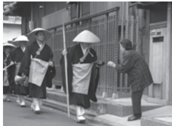
托鉢で市民に善意を呼びかけ

11月13日、古池公園運動場で市民体育祭が開催されました。全員参加のウォーミングアップ終了後、個人競技では50m走や100m走、団体競技ではチーム綱引きなどさまざまな競技が行われました。参加した人たちは、自分のチームを大声で応援するなどスポーツの秋を満喫していました。