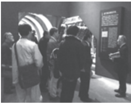
「展示デザインの視点」を開催

11月1日に総合体育館で、就学前の友だちづくりを目的に民間保育園全7園の5歳児約150人が集まり、交流会を開催しました。初めて出会うお友だちに少し緊張した様子でしたが、会がすすむにつれて違う保育園のお友だちと仲良くなり、楽しいひとときを過ごしていました。また公立保育所では、10月18日東雲公園で、全6か所の5歳児の仲よし交流会を開催しました。