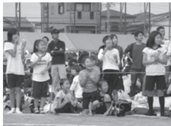
市民体育祭を開催