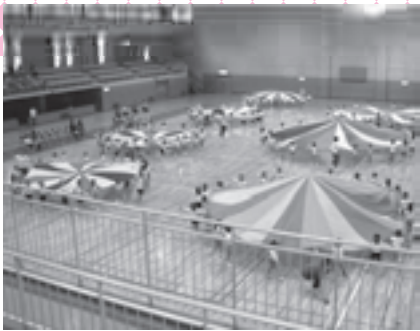
民間保育園5歳児の交流会を開催