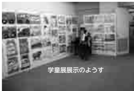
学童展示のようす

泉大津税務署では、平成23年度分の確定申告をテクスピア大阪(旭町22-45)で行います。会場では、所得税(譲渡所得を含む)、消費税、贈与税の申告書などの作成および受け付けを行います。なお、会場で納税はできませんので、お近くの金融機関をご利用ください。また、会場へは公共の交通機関をご利用ください。 開設時期 2月1日(水)～3月15日(木) 午前9時～午後5時(土・日曜、祝日を除く) ▽昼休みの時間帯は少人数の職員で対応していますので、ご了承ください。 ▽会場の都合により、午後4時ごろまでにお越しください。 ▽開設期間中、泉大津税務署庁舎内では、「作成済みの申告書などの受付」、「納税」、「納税証明書の発行」および「用紙の交付」のみを行います。 ▽会場では、パソコンを利用した申告書の作成を推進しています。 ▽お越しの際は、前年分の申告書の控えなどをご持参ください。 ▽申告書などの作成は、国税庁ホームページ「確定申告書等