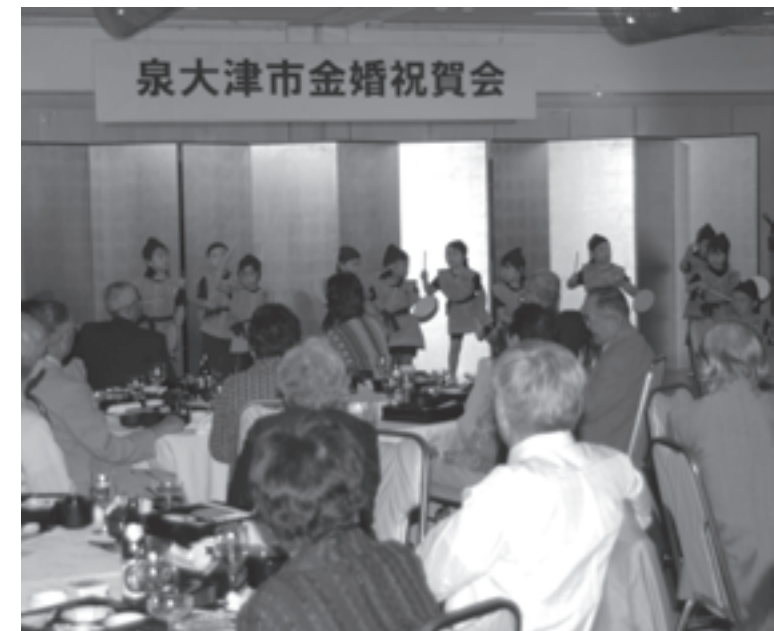
泉大津市金婚祝賀会