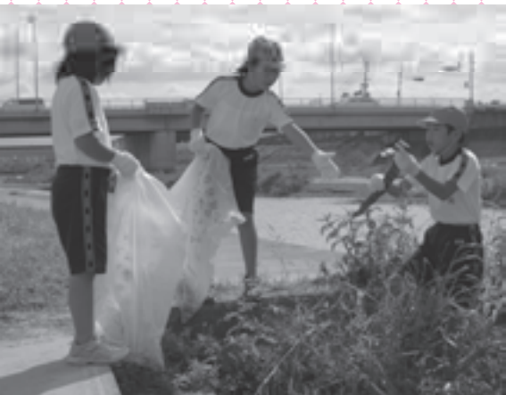
い 戎小4年児童が「水辺の学校」を開催 ろんな生物がいたぞ！

戎小学校の4年生が、10月3日に、大津川河川敷で河川敷の清掃や生物調べ、水質調査などを行う「水辺の学校」を開催しました。