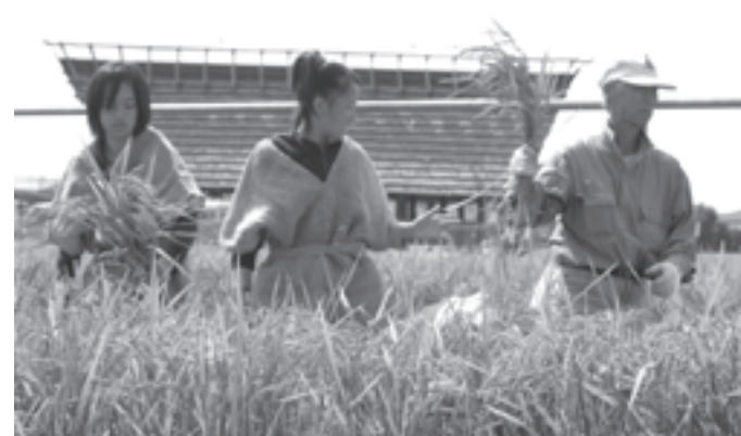
自 弥生学習館の稲作体験講座で稲刈り 分たちの育てた稲を収穫

9月24日、弥生学習館の稲作体験講座「こだい米クラブ」で子どもたちによる稲刈りが行われました。