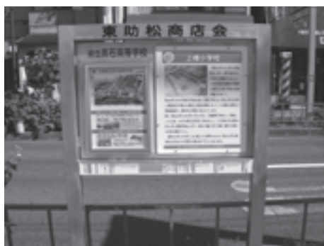
解 東助松商店街に文化財の看板を設置 説が写真と地図で表記

事前に採取した川の水の水質検査を行ったり、河川敷の清掃、さらに川に入り網を使い水生生物の採取を行いました。児童たちは、カニやオイカワ、ウナギの稚魚など10種類以上の生物を採取し、その種類の多さに驚いていました。