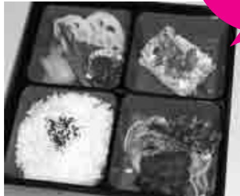
栄養士の手作り弁当(イメージ) お弁当に使用する食材は、すべて近商ストア泉大津店から市民の皆さんの健康に役立てればというご好意により、無償で提供いただいています