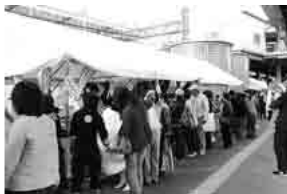
泉大津駅東ロータリーで開催される 「毛布謝恩セール」のようす