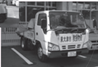
毛布を積み込み日高川町へ▶

本市では、台風12号による豪雨災害に見舞われた、市町村広域災害ネットワーク加盟市である、兵庫県高砂市へ防疫用の消石灰20トンと、友好都市である和歌山県日高川町に災害備蓄用毛布200枚を9月6日に搬送しました。また、12日には日高川町へ備蓄水1,200本（490ml缶）を追加搬送しました。