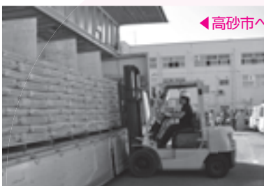
◀高砂市へ搬送した防疫用の消石灰