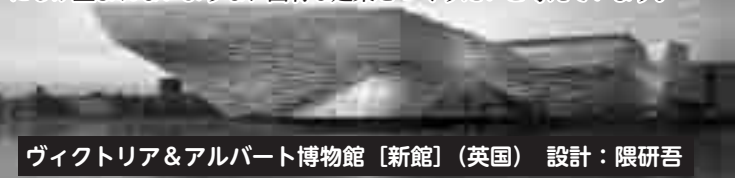
ヴィクトリア&アルバート博物館「新館」（英国）設計：隈研吾

「普遍性」がテーマの19、20世紀のモダニズム（近代主義）。建築はその場所の風土と切り離されて考えられていました。僕はこれからの建築を考える場合、その場所を掘り下げ、そのとき、またその場所にしか生まれないような、固有な建築をつくりたいと考えています。