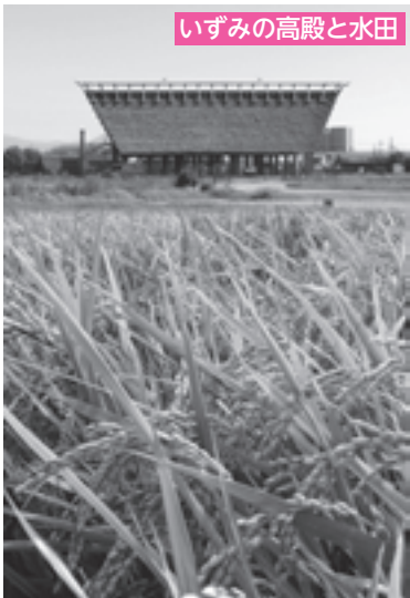
いずみの高殿と水田

期間／9月29日(木)～10月4日(火) 内容／いけばな展 なお、詳細は織編館へ