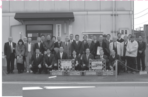
◀開所式終了後に関係者の皆さんと記念撮影

この「シンボルツリー」として、泉大津駅西側ロータリーに高さ10mのドイツウヒを植樹し、12月20日には関係者が参加しライトアップ点灯式を行いました。