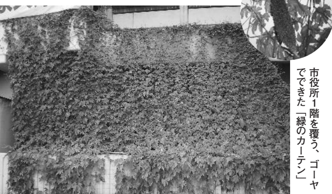
市役所1階を覆う、ゴーヤでできた「緑のカーテン」