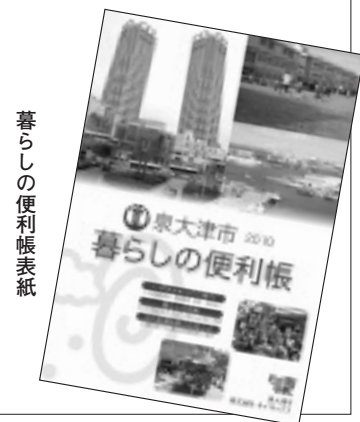
暮らしの便利帳表紙