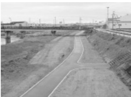
新しく整備した園路