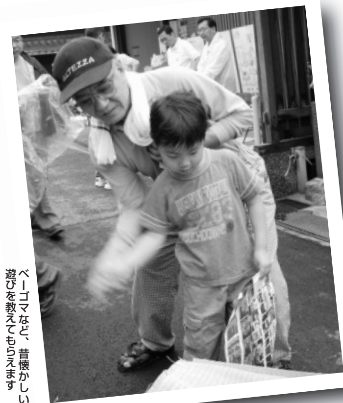
ベーゴマなど、昔懐かしい遊びを教えてもらえます