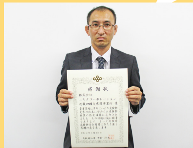
大阪府知事感謝状贈呈事業所 (株)ニヤクコーポレーション近畿四国支店堺事業所