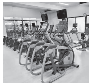
有酸素マシン (TVモニター付きです！)