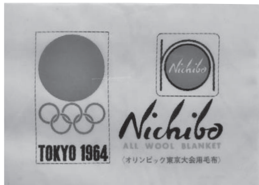
選手村で使用された毛布のタグ

オリンピックの開会が迫る 1964 年 9 月 15 日、東京都代々木に、世界 94 か国、約 7 千人の選手らが宿泊する施設として、オリンピック競技大会選手村が開村しました。66 万㎡の敷地に木造家屋 249 棟 343 戸、鉄筋 14 棟の建物が並び、レストランや浴場、ショッピングセンター、美容院、劇場、ガソリンスタンドなどが整備され、まさしく一つの村という様相を呈していました。