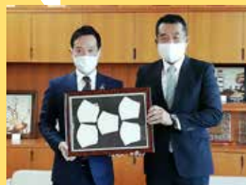
マスク寄贈 大津毛織(株) 様