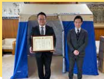
パーソナルテント寄贈 (株)セルビス 様