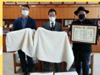
抗菌毛布寄贈 (株)オールユアーズ 様