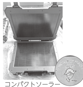
コンパクトソーラー 発電機