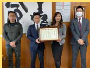
寄附金寄贈 (株)ジュエルフジミ 様