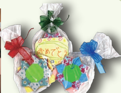
とってもかわいいコースターです