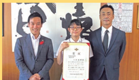
左から南出市長、八木さん、竹内教育長