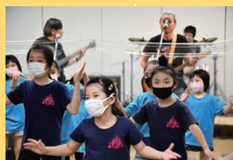
無観客ライブの様子