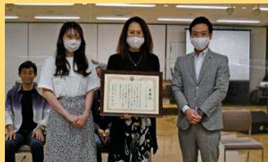
ダンススタジオきらり☆ 様