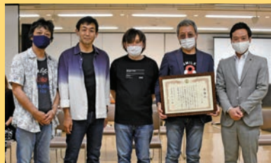
メガファー Z 様

なお、感謝状の贈呈式の際、無観客ライブを開催しました。その様子は、市ホームページでご覧いただけます。