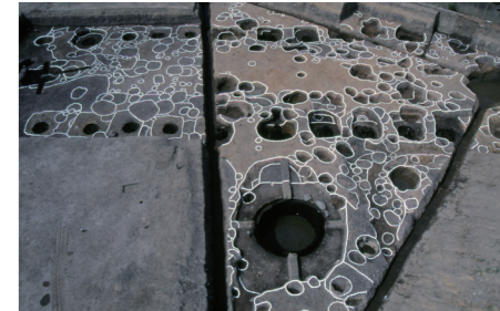
発掘された大型掘立柱建物と大型割り抜き井戸

弥生時代後期（紀元1～2世紀ころ） これまでの大規模集落の姿を失い、少数の家族単位のみとなり散在する状態に様相を変えます。