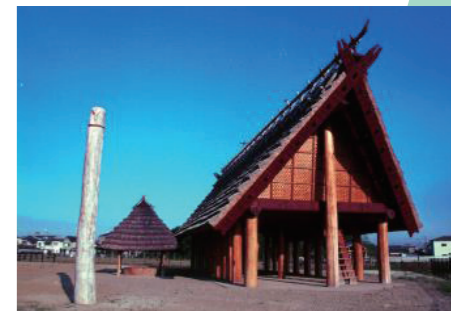
復元された大型掘立柱建物と大型割り抜き井戸