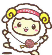
泉大津市マスコットキャラクター「おびづみん」