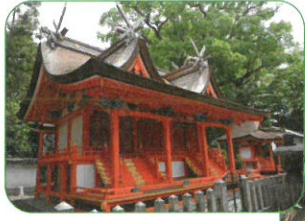
【地域資源との連携】