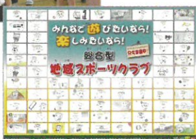
【総合型地域スポーツクラブ】