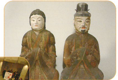
【重要文化財の保存・継承】

歴史的・文化的資源を保存し、次世代へ継承するために、調査・研究・活用を推進し、展示・講座などを通じて市民が学習する機会の創出と普及啓発に取り組めます。また、市民の自主的な文化・芸術活動の振興のため、活動鑑賞やイベントへの参加機会の提供、環境整備などの支援を行います。