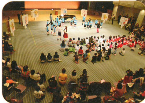
【文化・芸術活動の振興】