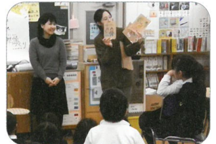
【活動市民との連携】

読書活動を推進するために、家庭、就学前施設、学校、図書館、地域などと連携し、読書環境の整備を行います。