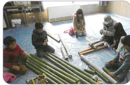
【公民館サポーターチームによるキッズプロジェクト】