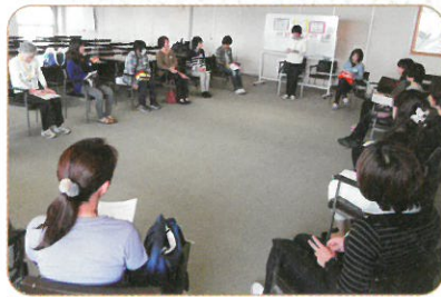
【子育てに関する学習会】

すべての保護者が家庭教育に関する学習や相談ができるよう、子育てに関する学習の機会や情報提供を行います。