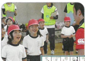
【体力向上プロジェクト】