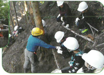
【日高川町との交流】

各分野と交流・連携し、地域資源を生かした教育の推進、放課後の子どもの居場所づくりの推進、家庭・地域の教育力向上の支援を行います。