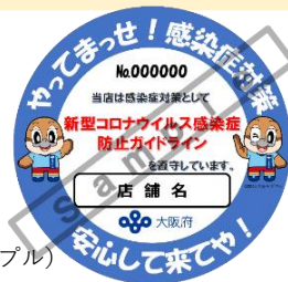
感染防止宣言ステッカー（サンプル）