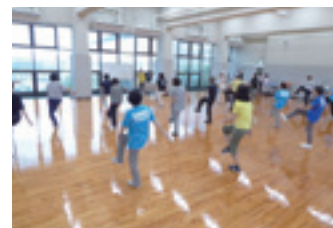
今からはじめるはじめてダンス教室の様子