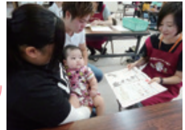
乳幼児健診での保護者への保健指導の様子