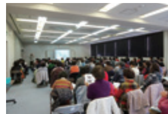
医師による健康教室の様子