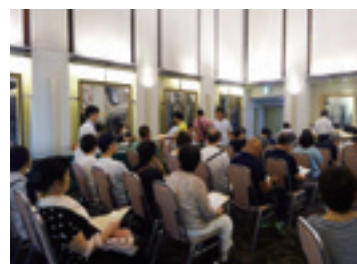
ホテル健診の様子