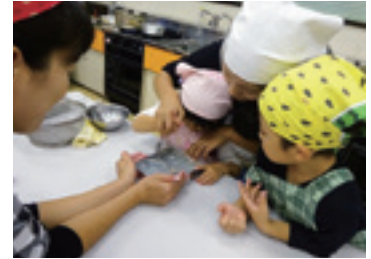
親子クッキングの様子