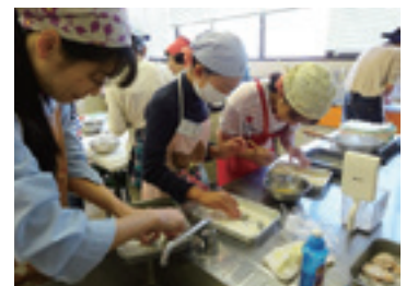
はじめてクッキングの様子