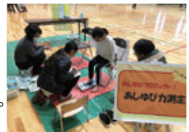
イベントでのあしゆび力測定の様子