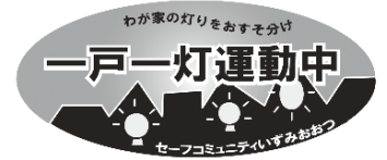
一戸一灯運動ステッカー

地域の暗がりを解消することで、不安やけがのリスクを減らすことを目的としています。