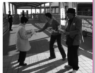
← 昨年のチェックリスト配布の様子

自殺を選ぶ人の中には、うつ病などの精神疾患にかかり、生きる意欲を失ったケースが多くみられることから、自殺予防対策委員会では厚生労働省が作成したうつ病チェックリスト入りマスクを今年も作成しました。3 月 17 日午前 7 時 50 分～8 時 20 分、午後 4 時 50 分～5 時 20 分に泉大津駅前配布予定です。お越しの際はぜひ受け取ってください。