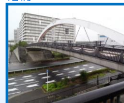
泉大津中央線跨線橋