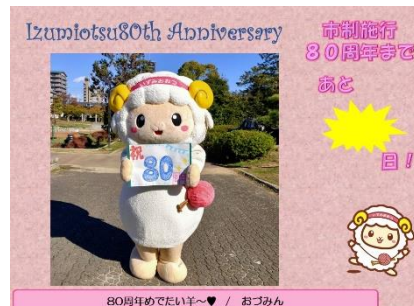
カウントダウンイメージ