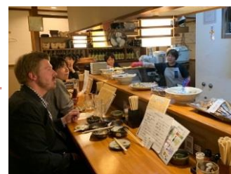
市内の居酒屋で取材中の講師と受講者

すでに3年目になるおもてなしガイド記事製作。グルメガイドはOZUバル(11月9日開催)を活用して、さらにたくさんのお店取材を決行。結果、ガイドマップには5店の新おすすめグルメが登場しています。