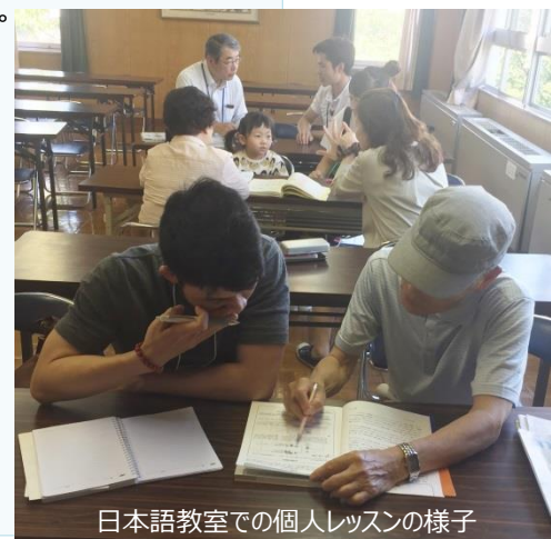
日本語教室での個人レッスンの様子

いずれも市役所企画調整課(TEL:0725-33-1131)までお問い合わせください。