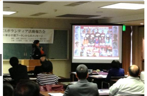
世界で活躍する泉大津市民