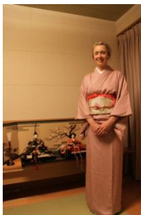
再認識する機会でもあったと思います。(和泉市 鶴山台/朝倉さん)

クリスティーナの初対面の印象は、とても華奢なかわいらしい女性でした。マラソン当日は天気も良く、ベストコンディションで完走でき、新聞のインタビューを受けていました。日本の文化体験では、茶道に参加し、帰宅後にビデオで茶道の番組を見ました。一期一会 (Once in a lifetime) の出会