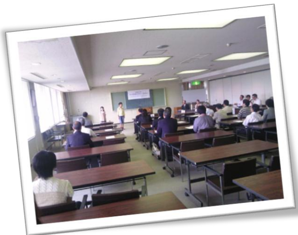
【問合】泉大津国際交流協会事務局（市役所企画調整課）

同協会は会員の方々の会費をもって各種事業を行うこととなり、目標としている市民単位での国際交流を推進していくためには、皆様のご理解とご協力が必要です。会員になって、本市における国際交流の推進、国際社会に対応する人づくり・まちづくりに参加しませんか？