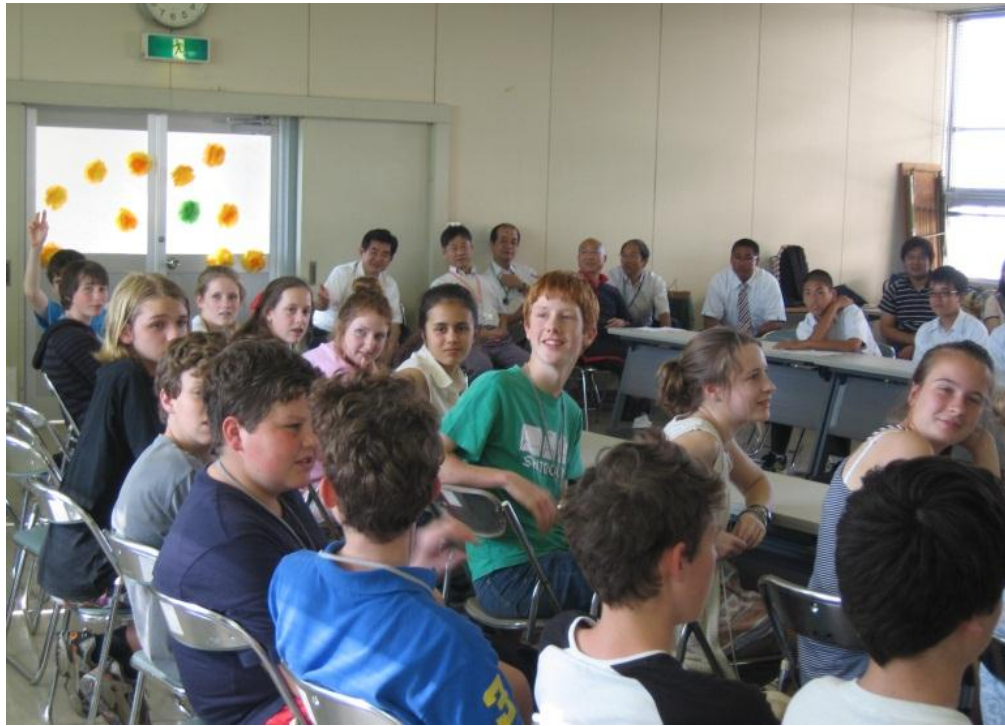
本市中学生とのディスカッションで盛り上がるグレート・ジオロンの中学生

平成 10 年度から続けている友好都市のオーストラリア・グレート・ジオロンの中学生と本市中学生との交流。2012 年 9 月はジオロンの中学生 18 名が本市を訪れ、一週間の滞在中にホームステイや観光を楽しみました。また、本市の中学生と互いの国や市について英語で紹介し合う「国際交流ディスカッション」も行われ、会場は大いに盛り上がりました。