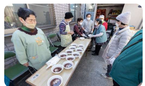
ぜんざいをふるまう あゆみ会の皆さん