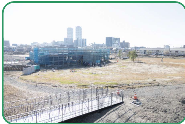
▲工事中のシーパスパーク

当日は天候にも恵まれ、植物を植えるワークショップ、工事中の公園内を案内するプログラムを実施しました。参加者はグループ毎に分かれ、これから誕生する公園を想像しながら、交代ですべてのプログラムを楽しみました。