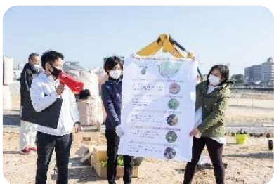
最初に作業手順を説明していただきました

園路に面する16平方メートルほどの緑地に、設計者や造園工事会社のサポートの下、市民の皆さんが人気の地被植物を植付けました。地被植物は成長を続けるため、市民の皆さんが植えてくださった緑はオープン後もずっと楽しんでいただくことができます。「とても楽しかった!」「オープン後、どれくらい大きくなっているか楽しみ」という感想をたくさん聞くことができました。