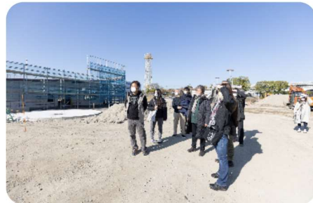
公園の目玉でもある小松山や泥んこ広場の利用を説明頂きました。