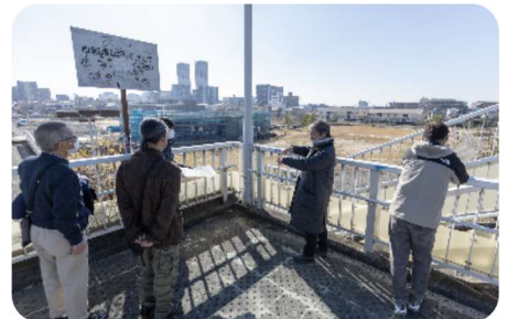
広大な芝生広場と建物の関係も体感し、完成した公園を想像しました。

このワークショップは本工事の請負会社である TSUCHIYA 株式会社さんの協力を得て、シーパスパーク・クラブの主導のもと、実施しました。