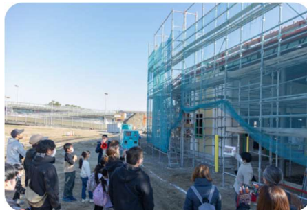
完成予想図と現物を見比べながら、できあがりの建物をイメージしました。