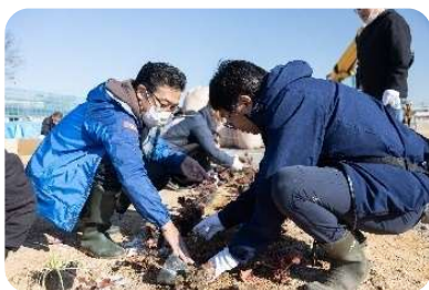
設計者、造園工事会社のアドバイスを貰いながら植付け