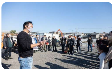
シーパスパーク・クラブ からの最初のごあいさつ

ワークショップ後には、春日町自治会館をお借りし、あゆみ会さんのご厚意で参加者の皆さんにぜんざいをふるまっていただきました。つきたてのお餅を食べながら、完成した公園での活動の話しに花を咲かせておられました。市民の皆さんで育てていくシーパスパークをこれからもよろしくお願ひします！