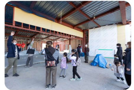
テラスになる場所を見ながら、将来の活動について想像しました。