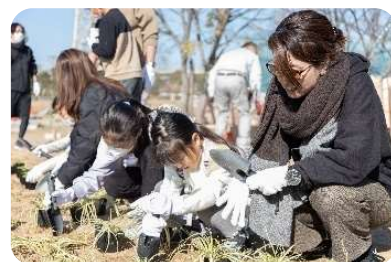
子どもたちも一生懸命、植えてくれました