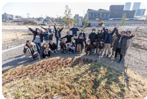
完成した花壇の前で記念撮影！