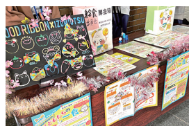
東陽祭でのフードリボンブース

また、こどもの居場所「板原こどもの家」によるフードパントリー(家で余っている食品などを集め、必要とする人へ無料で配布する活動)も実施されました。