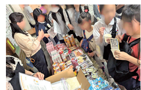
東陽祭でのフードパントリー