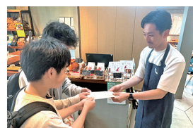
フードリボン店へお届け