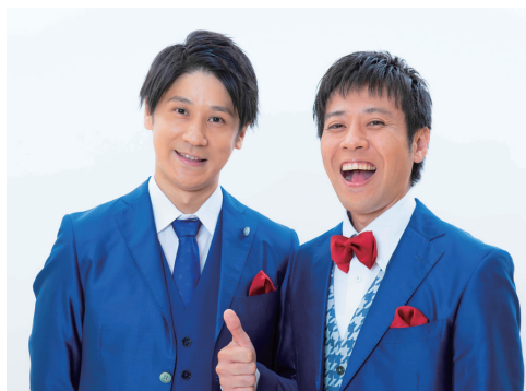
スマイル