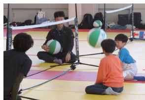
レクリエーションスポーツ