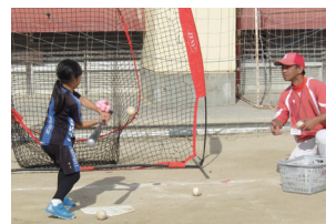
トスバッティング