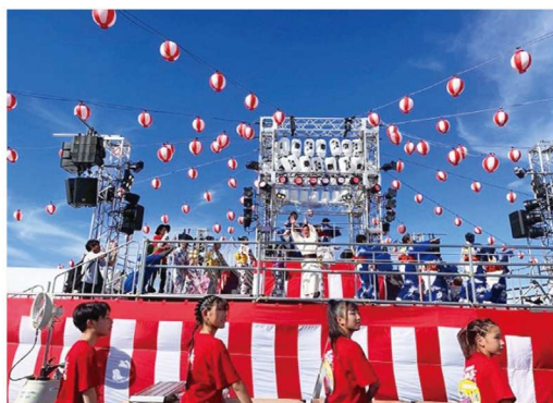
2025年大阪・関西万博で披露された REIWA盆ダンス

本市に伝わる「あびこ踊り」と「大津おどり」は、地域の歴史や人々の信仰を今に伝える貴重な文化遺産です。これらの踊りは、保存会をはじめとする地域住民の熱意と努力によって守られ、時代を越えて受け継がれてきました。