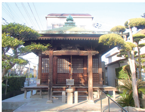
現在の穴師薬師寺

あびこ踊りは、泉穴師神社を中心とした我孫子地域で受け継がれてきた踊りです。その特徴は、綿花を摘む動作を思わせる振り付けにあります。江戸時代の泉州地方は、綿花の栽培が盛んで稲よりも多くの綿花を耕作しているといわれるほどでした。綿花を摘む動作は、豊作を願う人びとが踊りに取り入れたのでしょう。当時の生活や願いと深く結びついた踊りだと考えられます。