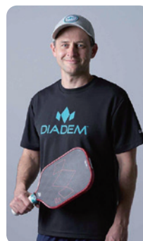
元ピックルボール全米チャンピオン ダニエル・ムーア氏