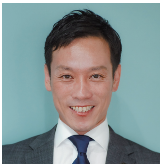
泉大津市 市長 南出 賢一

自治体で初めて、消費地と生産地をつなぐ「新たな“食”のサプライチェーン」を構築。米不足を予測し、全国の自治体に先駆けて市民へのお米販売の仕組みをつくった先進的リーダー。