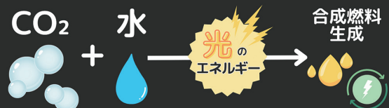
▲合成燃料生成における仕組み

「IZUMIOTSU WELL-BEING EXPO2024」では、イベント会場で使用した電力の一部を、合成燃料により発電した電力でまかないました。