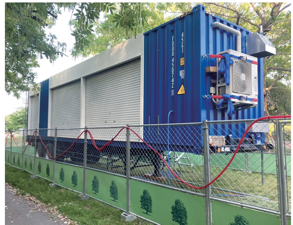
▲助松公園での実証実験の様子