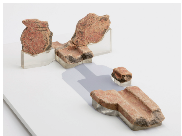
大園遺跡出土の槽槌形土製品(大阪府教育委員会蔵)