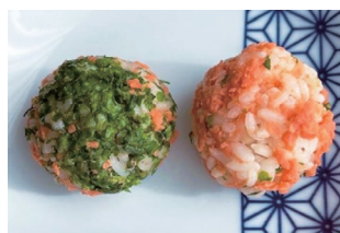
“ふりふり”おにぎり