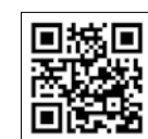
母子寡婦福祉連合会