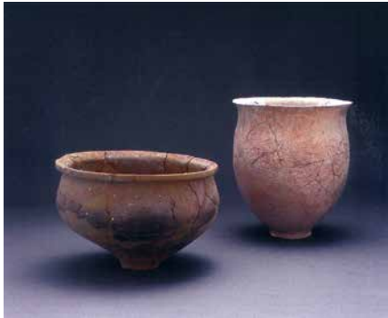
河内の土器(左)と紀伊の土器(右) (弥生時代中期 池上曽根遺跡出土)

土器はその形や文様、素材となる粘土を観察することで、どこで作られたものかを推定することができます。池上曽根遺跡の集落は、河内地域とのつながりが特に強く、多くの土器が持ち込まれています。チョコレートのようなこげ茶色が特徴で、弥生時代のどの時期でも一定量が見つかります。