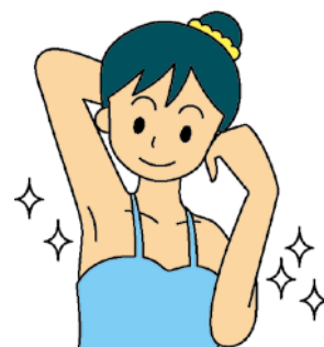
消費者庁 イラスト集より

特定継続的役務提供契約は、契約期間内であれば所定の費用を支払うことで中途解約が出来ます。