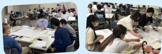
キャッチフレーズ案を決めるワークショップの様子

“繊維のまち”のこれまでの歩みを『つむぐ』という表現で、また、80 周年の「80」をとり、末広がりの未来へ!という想いが込められています。(「おづ」は同市域が古くから「小津」と呼ばれていたことに由来)