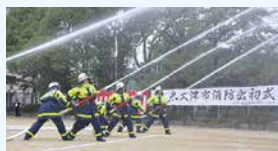
出初式での一斉放水

火災や地震・台風などの災害対応はもちろん、普段から万が一の災害に備え、さまざまな訓練や防火・防災・救急に対する啓発活動を行っています。活動に興味のある人や入団などはホームページをご覧ください。