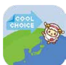
アプリのダウンロードは下記二次元コードから