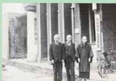
創設当時の図書館(昭和 24 年)