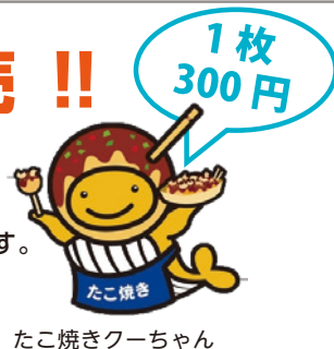
たこ焼きクーちゃん