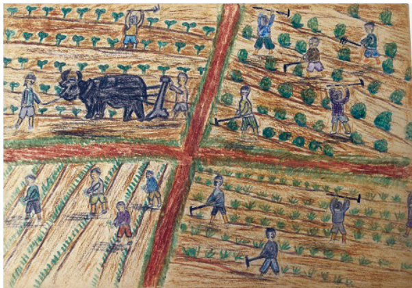
畠の手伝いをする子どもたち 紙芝居「たくましく ただしく」より

1945年8月15日第二次世界大戦は終結しましたが、子どもたちはすぐに家に帰ることができず、9月5日になってやっと、10月末の引きあげが決まりました。この期間、これまでお世話になった人たちに向けて謝恩会を開催したり、遠足に出かけたりするなど、有意義に過ごしたようです。引揚げ当日、泉穴師神社に集合してから泉大津駅に向かい南海電車で帰郷しました。しかし大阪大空襲により安立国民学校は全焼し、自宅を失った子どももあり、すぐに以前の暮らしを取り戻せたわけではありませんでした。