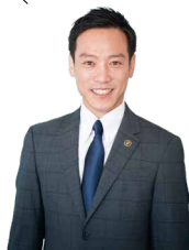
泉大津市 南出賢一市長