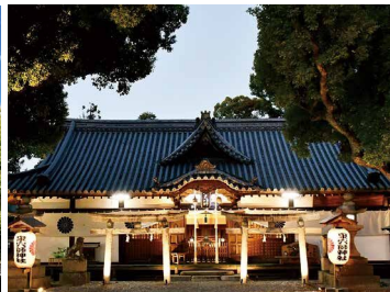
御神木であるクスノキは、倒木後も新たな芽を育てており、その姿は自然の力強さと神秘性を感じさせます。