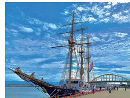
「泉大津大橋とみらいへ」