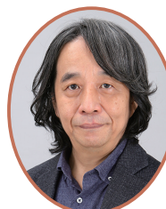
ありすがわ ありす 有栖川 有栖氏