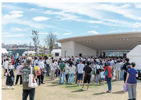
昨年9月に開催した「IZUMIOTSU WELL-BEING EXPO 2024」の様子

万博イヤーの今年は、市全体を万博のサテライト会場に見立てて、市民や市内で活動している団体のみなさんと一緒に、市内のいたるところでイベントを実施する「いずみおおつ“まちなか万博”」を開催します。