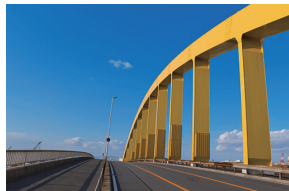
「青と黄色のコントラスト」