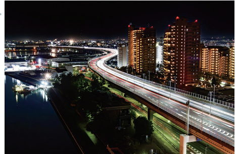
「光り輝くみなとまち」