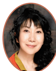
むろい しげる 室井 滋氏