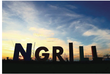
「仲間とビールと、西の空」