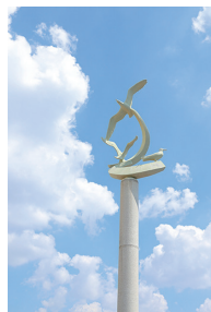
「in the sky」