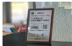
フロントデスク (A4スタンド)