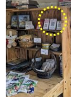
商品陳列棚や観光情報 ラック等への設置