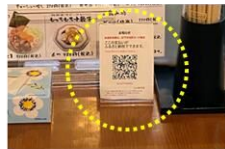
テーブルスタンド (二次元コード)