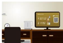
客室内 (サイネージ)