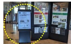
サイネージ (画像素材提供)