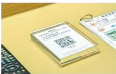
クリスタル (二次元コード)