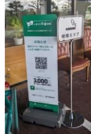
立て看板 (耐風仕様)